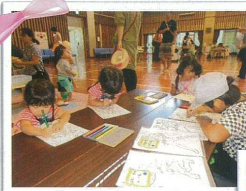
▲上手に色めいできたね♪

9月14日(土)みとよ福祉まつり'19を市民交流センター・豊中町農村環境改善センターにて開催し、2階体育館へファミサポブースとして出展しました。ブース内では、ファミサポ出張登録・子どもの遊び場・展示を行いました。暑い中、ご来場頂いたみなさまありがとうございました。