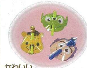
かわいいみきもじを プレゼント♪