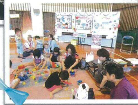
▲おもちゃコーナーにはたくさんのおもちゃたちが遊びに来てくれました♡